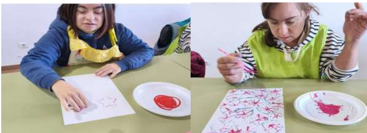
(Actividades de desarrollo cognitivo)

Tiene como finalidad promover la capacidad de decisión y la gestión de la vida diaria. Se llevó a cabo a través de un enfoque centrado en la persona. Mediante experiencias en entornos reales. Como resultado, se ha observado una mejora notable en la autonomía y en la calidad de vida de las personas participantes.