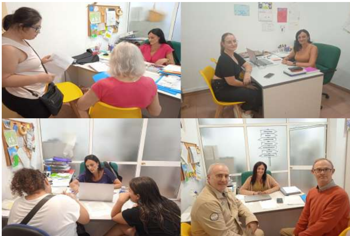
(Acompañamiento de familias)