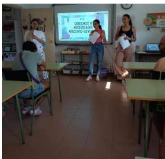
(Jornadas de sexualidad)