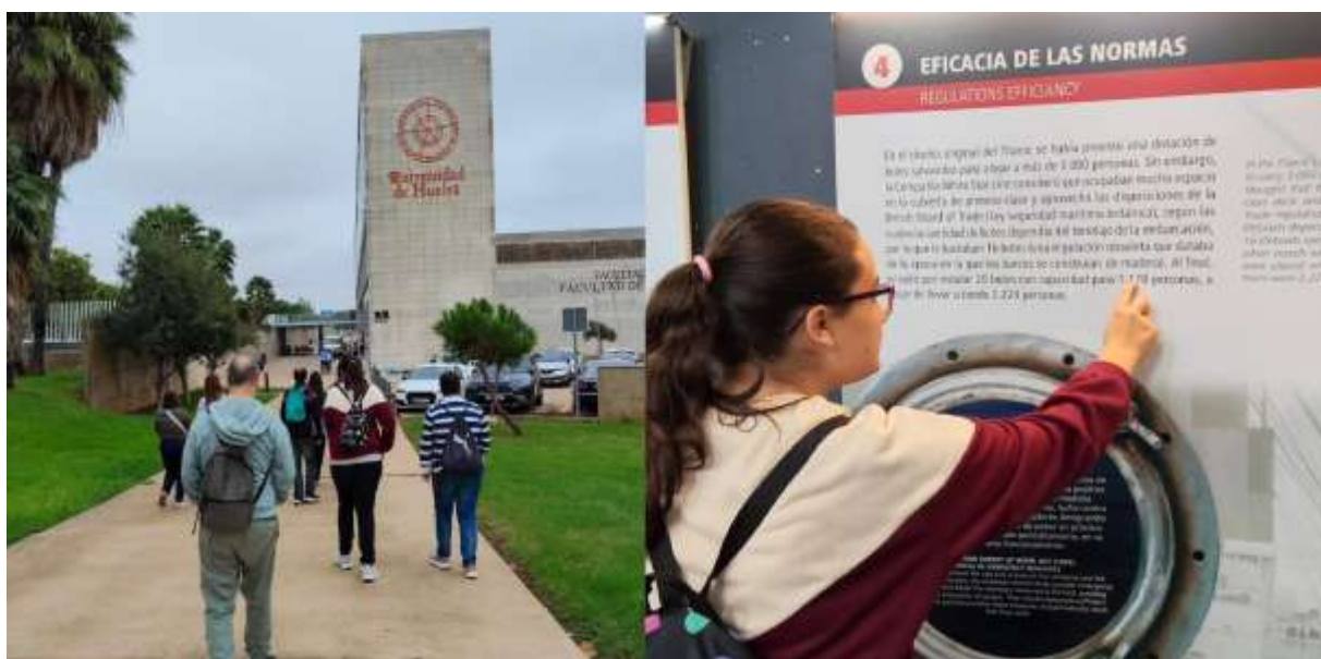
(Salidas de autonomía)

En términos generales, el proyecto pretende consolidar un espacio adaptado y funcional que permita continuar desarrollando programas de autonomía personal de manera eficaz y sostenible, promoviendo oportunidades reales de participación, aprendizaje y mejora de la calidad de vida de las personas con discapacidad intelectual.