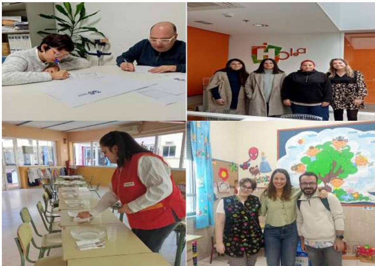
(Personas usuarias en prácticas)

En términos generales, el proyecto buscó no solo mejorar las posibilidades de acceso al empleo de las personas participantes, sino también fortalecer su autoestima, autonomía y calidad de vida, favoreciendo su reconocimiento como ciudadanos activos y capaces dentro de la sociedad. Del mismo modo, la iniciativa contribuyó a sensibilizar al entorno social y empresarial sobre la importancia de la igualdad de oportunidades y la inclusión laboral de las personas con discapacidad intelectual.