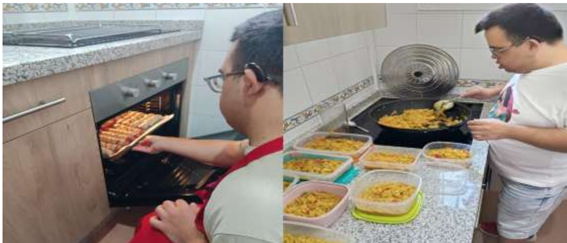
(Actividades de cocina saludable)

Enseña a personas con discapacidad intelectual habilidades básicas de cocina para fomentar su autonomía en la vida diaria. A través de actividades prácticas, aprendieron a preparar recetas sencillas, manipular alimentos de forma segura y seguir rutinas, promoviendo también la responsabilidad y el trabajo en equipo.