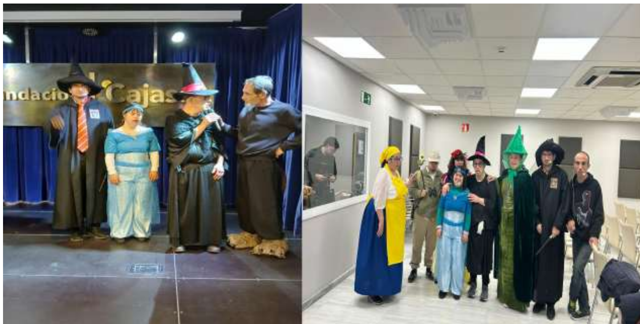
(Actuación de teatro en Fundación Cajasol)